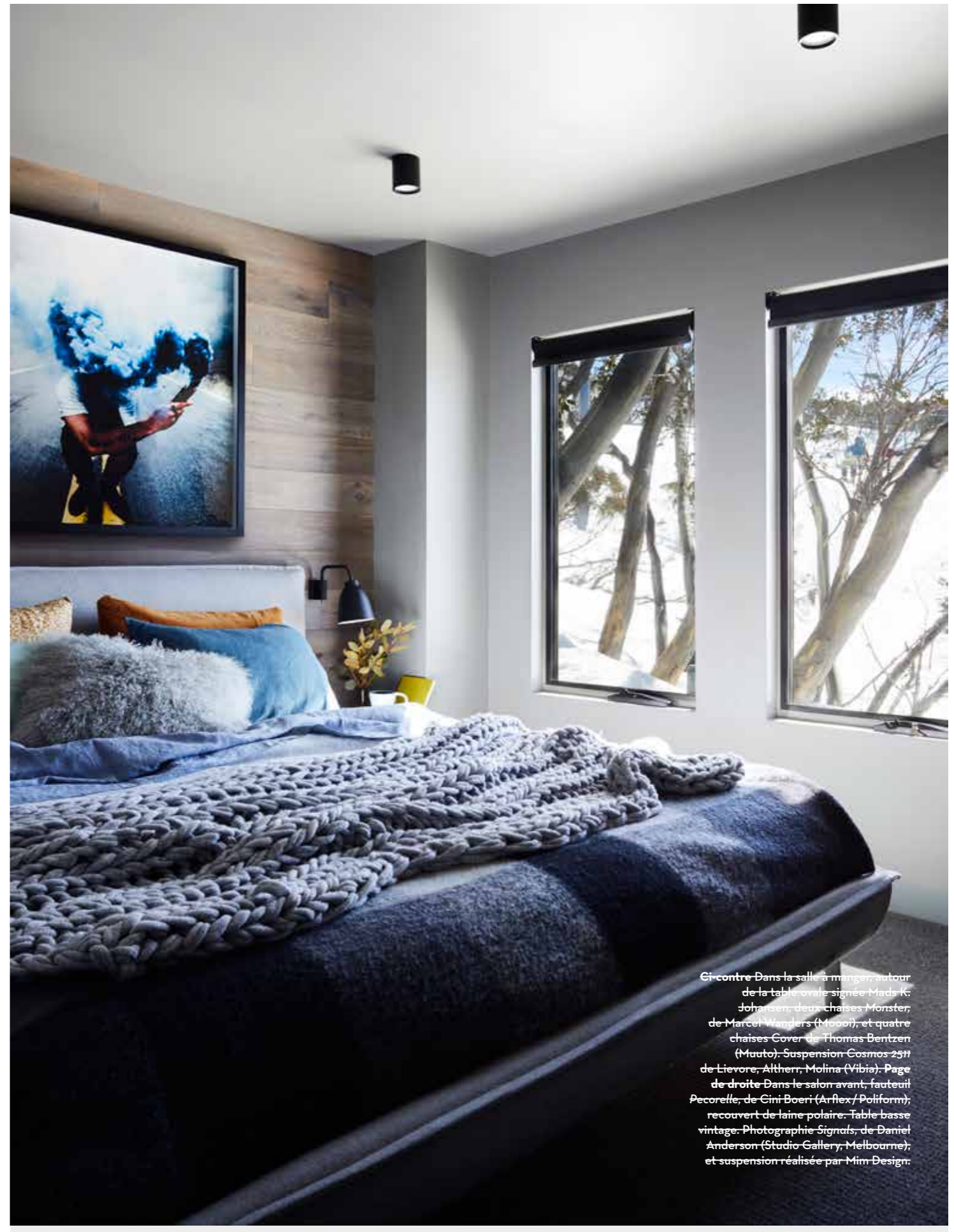
Ci-contre Dans la salle à manger, autour de la table ovale signée Mads K. Johansen, deux chaises Monster, de Marcel Wanders (Moooi), et quatre chaises Cover de Thomas Bentzen (Muuto). Suspension Cosmos 2511 de Lievore, Altherr, Molina (Vibia). Page de droite Dans le salon avant, fauteuil Pecorella, de Cini Boeri (Arflex/Poliform), recouvert de laine polaire. Table basse vintage. Photographie Signals, de Daniel Anderson (Studio Gallery, Melbourne), et suspension réalisée par Mim Design.