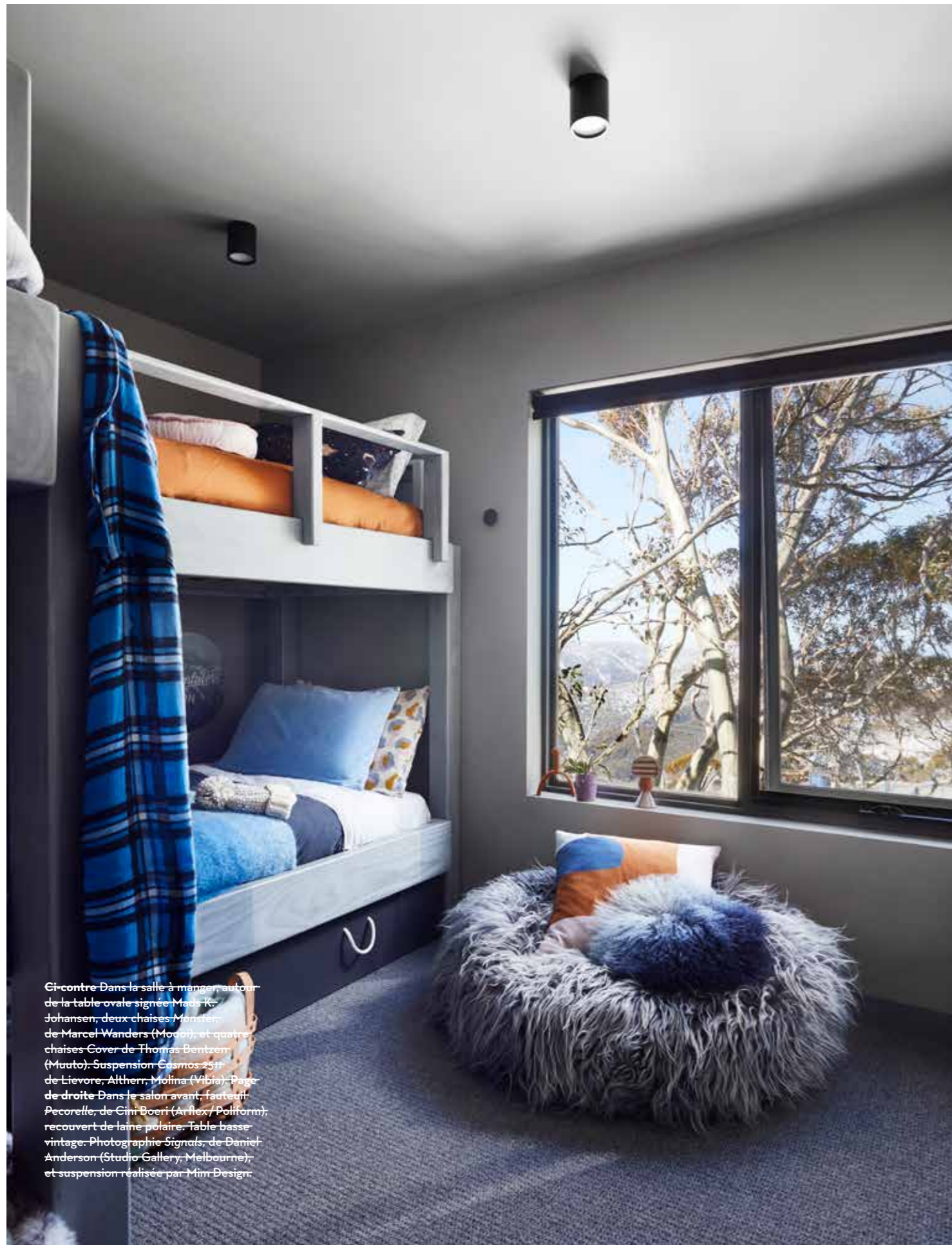
Ci-contre Dans la salle à manger, autour de la table ovale signée Mads K. Johansen, deux chaises Monster, de Marcel Wanders (Moooi), et quatre chaises Cover de Thomas Bentzen (Muuto). Suspension Cosmos 2511 de Lievore, Altherr, Molina (Vibia). Page de droite Dans le salon avant, fauteuil Pecorella, de Cini Boeri (Arflex/Poliform), recouvert de laine polaire. Table basse vintage. Photographie Signals, de Daniel Anderson (Studio Gallery, Melbourne), et suspension réalisée par Mim Design.